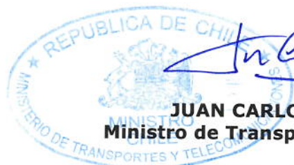
JUAN CARLOS MUÑOZ ABOGABIR Ministro de Transportes y Telecomunicaciones