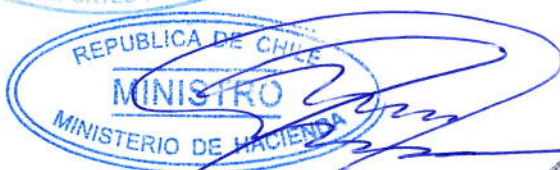
MARIO MARCEL CULLELL Ministro de Hacienda